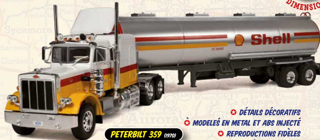
PETERBILT 359 (1970)