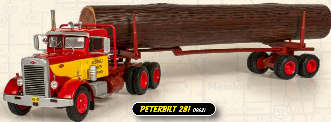
PETERBILT 281 (1962)