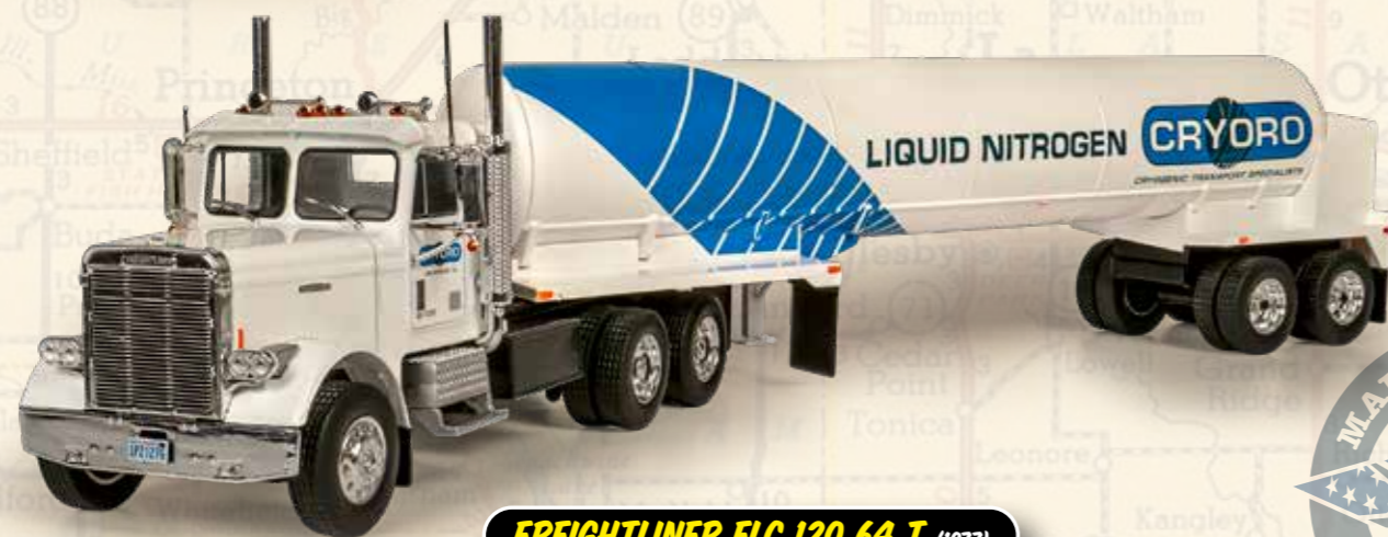
FREIGHTLINER FLC 120 64 T (1977)