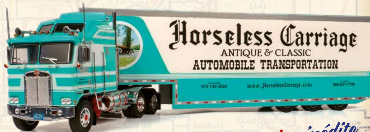
KENWORTH K100 AERODYNE (1976)