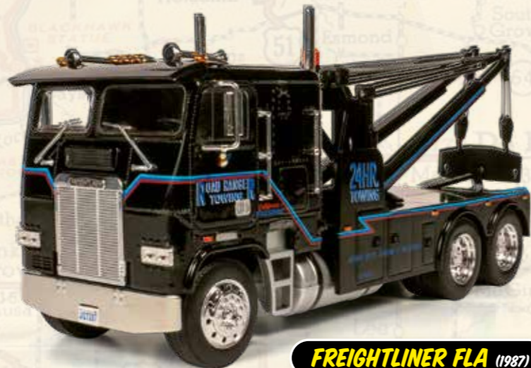
FREIGHTLINER FLA (1987)

Réalisées en métal et plastique injecté, les répliques en miniature de ces colosses de la route répondent aux désirs des collectionneurs les plus exigeants.