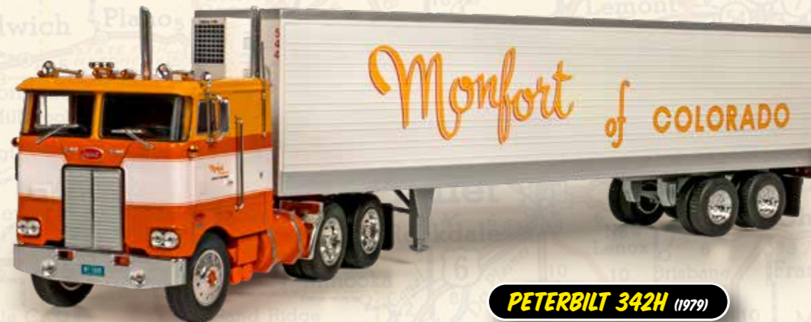
PETERBILT 342H (1979)