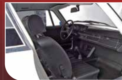
Türen und Fenster mit Öffnungs- und Schließmechanismen