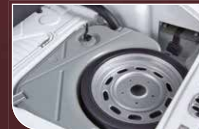
Komplettes Zubehör: Notrad, Batterien, Details der Instrumententafel...