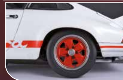
Sehr reell wirkendes, originalgetreues Modell