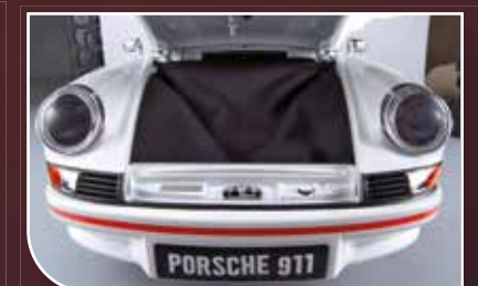
Ein Schmuckstück für die Sammlung

Nicht verträgliche Bilder. Produkt bestimmt für Erwachsene. Nicht geeignet für Kinder unter 14 Jahren. Dies ist kein Spielzeug. Der Verlag stellt sich vor, die Herausgabe bei schlechten Verkaufszahlen einzustellen. Die Bauteile Ihres Modells bestehen aus Metall und Kunststoffspritzguss. Batterien sind nicht enthalten. Herausgeber: Editorial Planeta DeAgostini, S.A. Unipersonal, Avenida Diagonal, nº 662-664, 08034 Barcelona. Handelsregister Barcelona, Blatt 60.461, Band 6776, Buch 6065, 1. Eintragung.