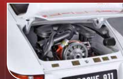
Äußerst detailgetreue Motornachbildung