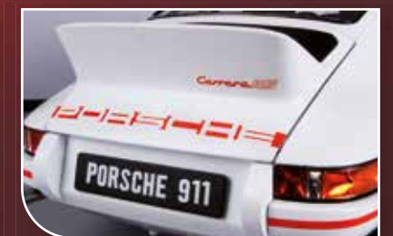
Funktionsfähige Scheinwerfer, Bremsleuchten und Innenbeleuchtung