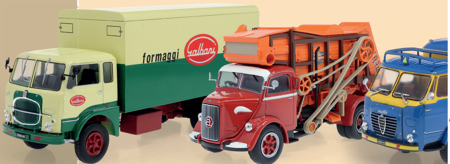
Fiat 643 N (1963)

Un'occasione unica per collezionare i modelli più iconici delle più celebri ca I modelli riproducono allestimenti e versioni speciali come camion frigo, au