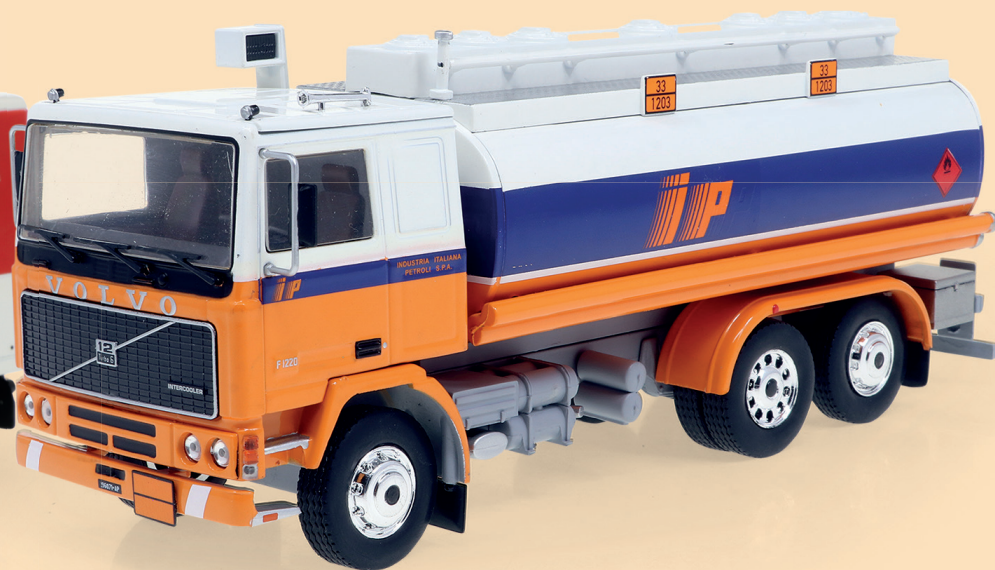
Volvo F1221 (1983)

L'Editore si riserva il diritto di variare la sequenza delle uscite della collezione e/o i prodotti allegati. Forme e colori possono variare rispetto a quelli raffigurati. La tua collezione si compone di 67 uscite. Prezzo primo numero € 6,99, anziché € 14,99. Prezzo secondo numero € 14,99. Prezzo numeri successivi € 24,99. Salvo variazione delle aliquote fiscali.