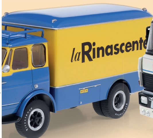
la Romeo Mille (1958)

ori case produttrici di camion dagli anni Cinquanta agli anni Ottanta. o, autocisterne e molti altri.