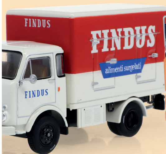
OM Leoncino (1965)