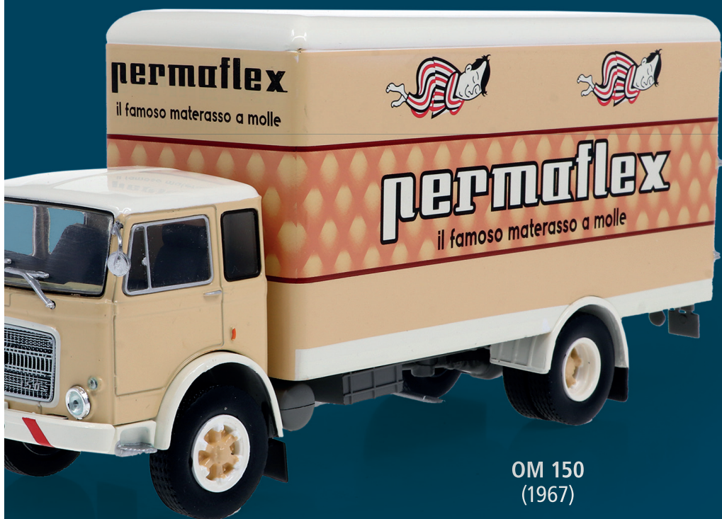
OM 150 (1967)

Modelli esclusivi che rappresentano autentici oggetti da collezione.