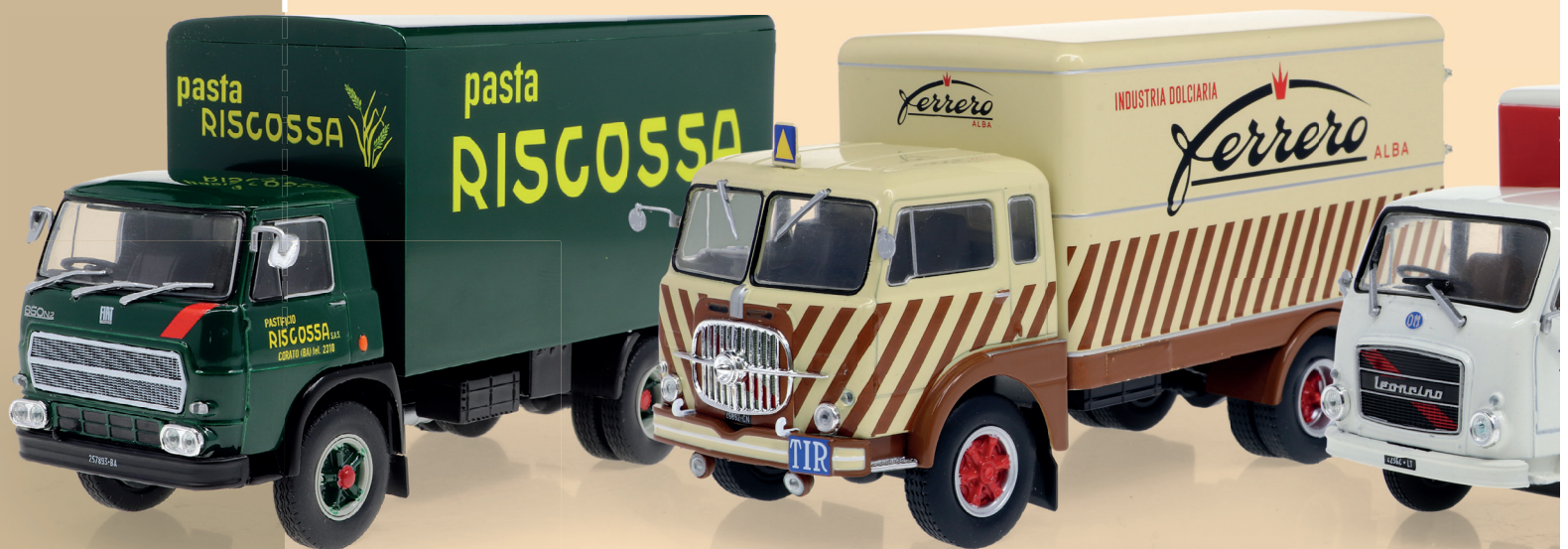
Fiat 650 N2 (1969)